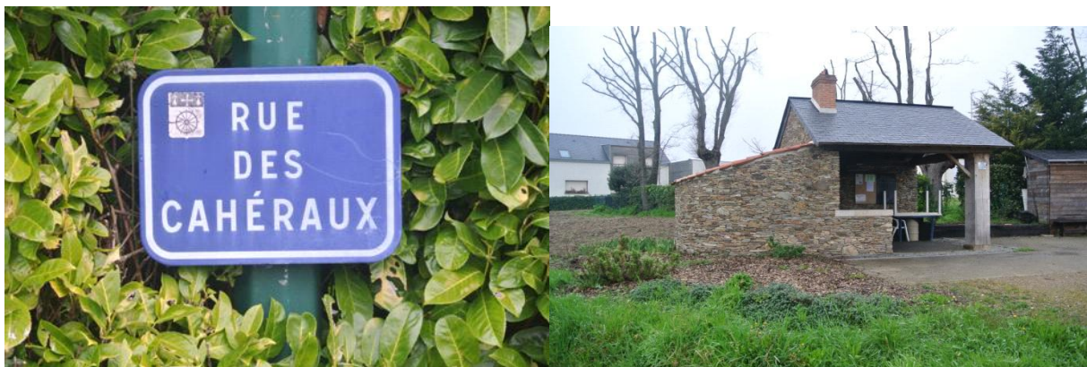
Fig. n°1 : le four à pain des Cahéaux, récemment restauré